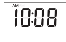
Izpis na zaslonu v načinu CLOCK