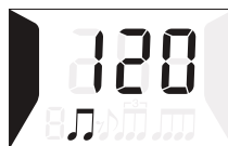
Izpis na zaslonu v načinu METRONOME

Pritisnite na gumb MODE in prestavite na način CLOCK (ura), nato pritisnite in držite gumb BEAT (ritem). Pritiskajte gumb BEAT (ritem) in izberite uro ali minute ter uporabite gumba UP in DOWN za prilagajanje števk. Izbrane številke se bodo zasvetile. Pritisnite gumb MODE za izhod in vrnitev v način CLOCK. Sekund se ne da prilagajati in se samodejno poravnajo na 0. Čas se naravno do sekunde z ročno sinhronizacijo z uradno uro. Metronom se samodejno vrne v način CLOCK po minuti nedelovanja.